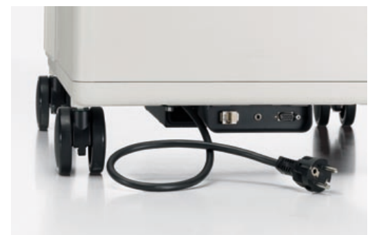
Ein Steckfeld für viele Einsatzzwecke (Media) und der Stromkabeleinzug (Media und Catering) machen die Arbeit mit Caddy einfacher.