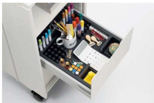
Mit der Utensilieneinsatz aus Integralschaum lassen sich Inhalte einfach organisieren (Standard, Media und Catering).