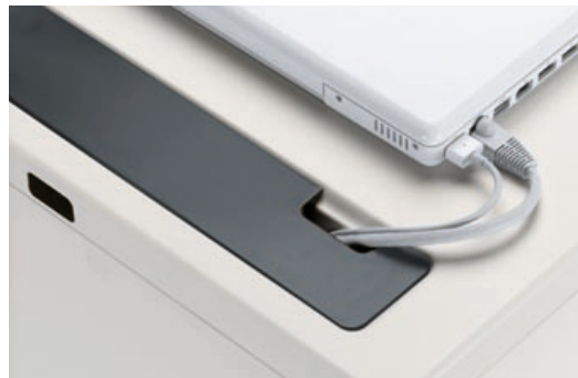
Die durchdachten Elektrifizierungslösungen setzen sich im Innern fort (Media und Catering).

Caddy ist mit funktionalen Detaillösungen versehen, wie einem raffinierten magnetischen Türmechanismus, einem Utensilien-einsatz aus Integralschaum, einem ausfahrbaren Kleiderhaken oder flexiblen Trennschieds aus Stahlblech zur individuellen Unterteilung der Schubladen, die über einen Softeinzug verfügen.