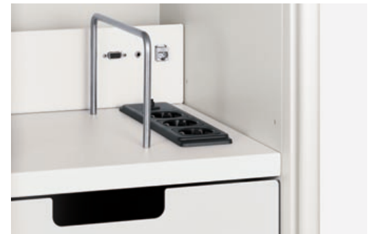
Praktisch und in Griffhöhe: die Elektrifizierung von Caddy (Media)