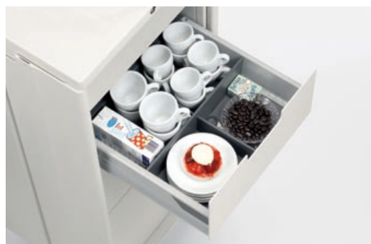
Lösungen für diverse Inhalte: Caddy eignet sich auch für Cateringzwecke (Standard, Media und Catering).

Um das Innenleben von Caddy auf die unterschiedlichsten Bedürfnisse auszurichten, stehen viele Optionen zur Verfügung: Fachböden, Schubladen in verschiedenen Höhen mit diversen Einlagen sowie verschiedene Möglichkeiten der Elektrifizierung und des Kabelmanagements. Eine Nachrüstung von Caddy ist entsprechend einfach.