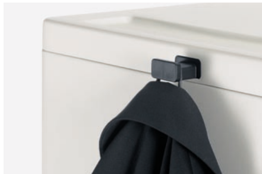
Praktisches Detail: der ausfahrbare Kleiderhaken (Standard, Media und Catering)