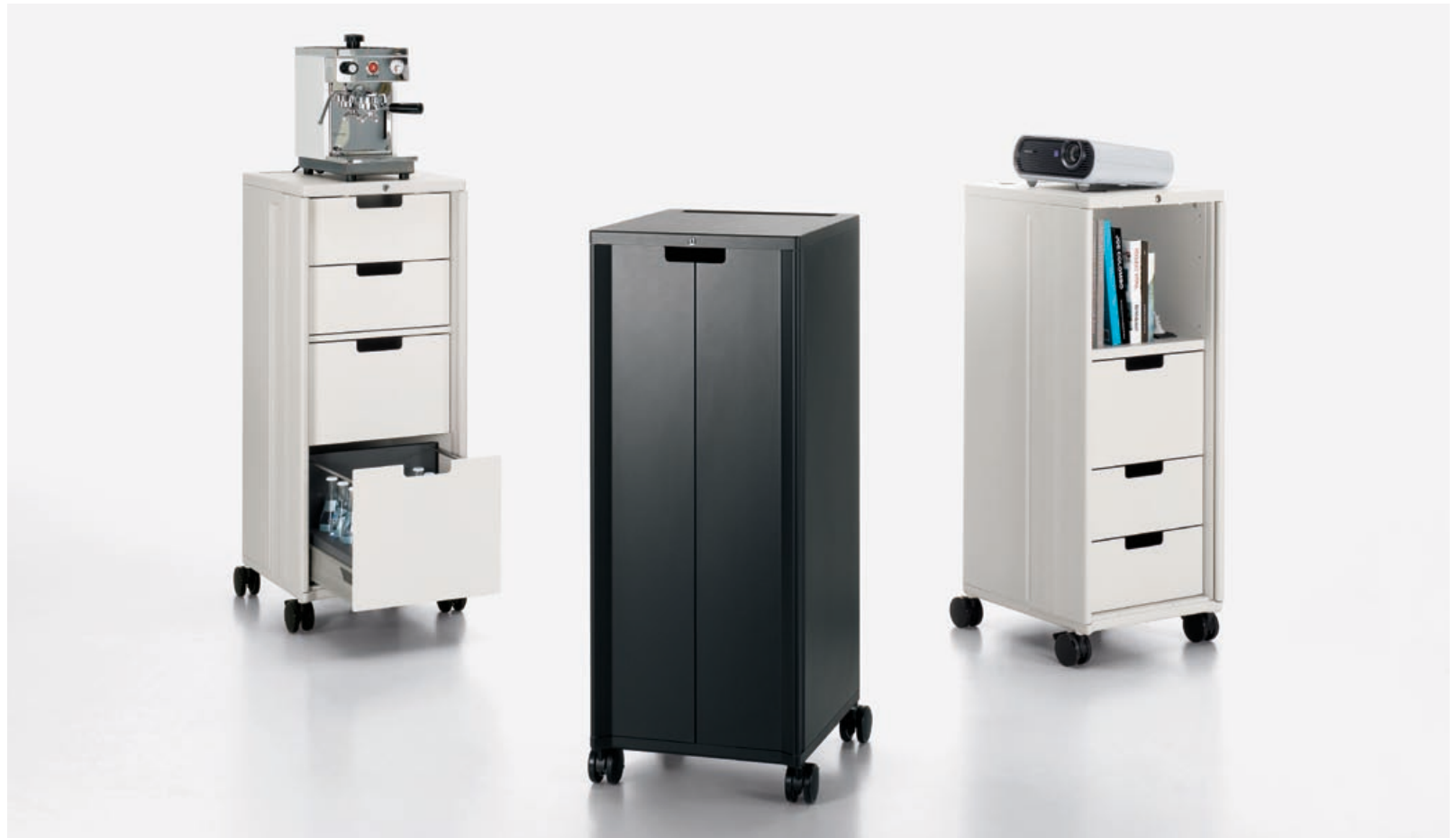
Mit seiner zurückhaltenden Gestaltung fügt sich Caddy nahtlos in die unterschiedlichsten Umgebungen ein. Die drei Modelle Standard, Media und Catering lassen sich jeweils weiter individuell konfigurieren.

Christoph Ingenhoven liess sich von Flugzeugtrolley's zu Caddy inspirieren. Dieses mobile Stauraummöbel zeichnet sich deshalb durch folgende Kernmerkmale aus: Es ist flexibel, robust, praktisch und langlebig. Seinem zurückhaltenden Äusseren stehen unzählige Möglichkeiten gegenüber, den Innenraum individuell zu konfigurieren: Als Ausgangspunkt für verschiedene Bedürfnisse dienen dabei die Grundvarianten Standard, Media und Catering. So steht Caddy als flexibles Stauraummöbel, mit raffinierten Elektrifizierungsoptionen als mobiler Steharbeitsplatz auf kleinstem Raum, für Konferenzen und Präsentationen mit Beamer oder mit massgeschneidertem Innenleben zu Cateringzwecken zur Verfügung.