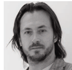
by D. Chanceller

Kleiderständer aus satiniertem Nickel in 2 verschiedenen Abmessungen. Satz von 6 Kleiderbügeln aus satinierter Edelstahl ist verfügbar.